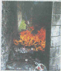
PARTE DE la droga quemada en los tribunales de San Salvador.

Muchos de los adictos con alto nivel económico, pero que han perdido todo su dinero en el vicio de drogas como la cocaína u otras más sofisticadas, han terminado por con-